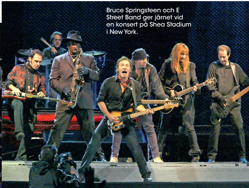
Bruce Springsteen och E Street Band ger järnet vid en konsert på Shea Stadium i New York.